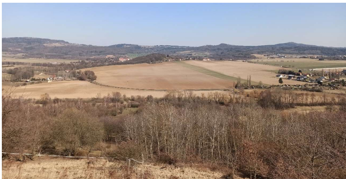
Fenomén: sopečný hřeben spojující vrchy Kumburk a Tábor

Sdělení: Krajina před námi není jen pozvolným klesáním podhorského reliéfu do nížiny, její charakter je ovlivněn sopečnými kužely i sopečným hřbetem, který tvoří rozhraní mezi dvěma různými krajinami (chladným Podkrkonoším a teplým Polabím).