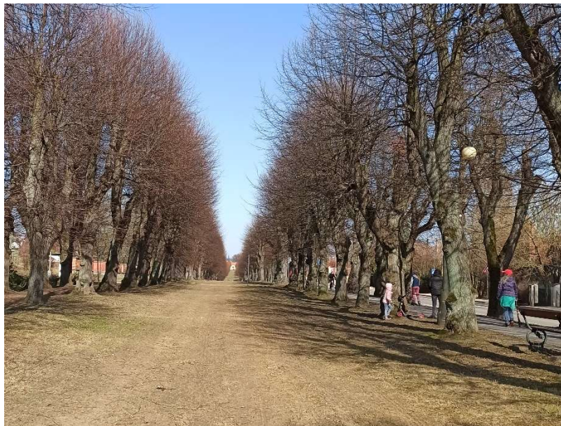
Fenomén: Valdštejnova lipová alej

Sdělení: Lipová alej, kterou Valdštejn položil jako jednu ze základních linií své barokní komponované krajiny, je dnes vpadlá do útrob rozrůstajícího se města – namísto krajinného prvku se z ní stala důležitá součást městské zeleně, která dnes funguje jako přírodní pás vedoucí z centra města na jeho okraj.