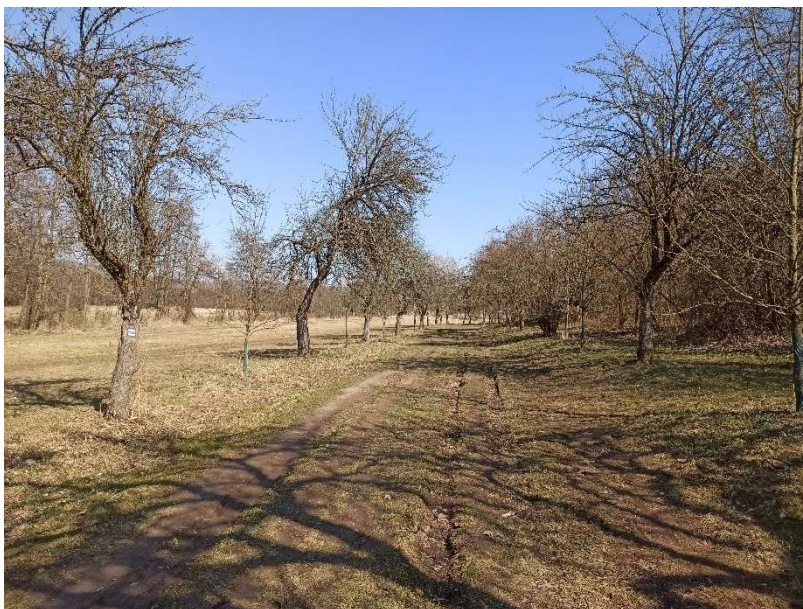
Fenomén: stará polní cesta

Sdělení: Stará polní cesta je krásným příkladem toho, jak harmonizující a bytostně příjemné je zažívat krajinu, kde nás neruší nic moderního. I přes svou nespornou (historickou, estetickou, ekologickou i psychologickou) hodnotu je však tato cesta ohrožena naší snahou dělat si život stále více a více pohodlný.