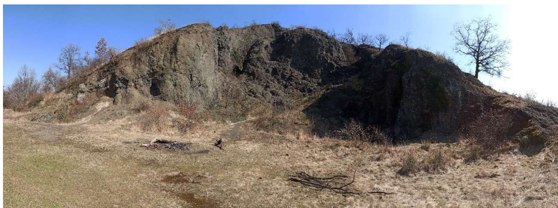
Fenomén: lom v kopci Zebín

Sdělení: Malý lom, který zůstal nedotěžený, je dnes fascinujícím místem a cenným „okem“ do nitra sopky.