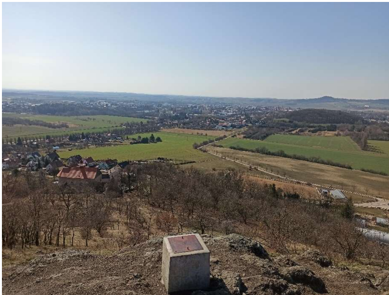
Fenomén: město Jičín

Sdělení: Jičín je příkladem města, jehož původní místo založení se neujalo.