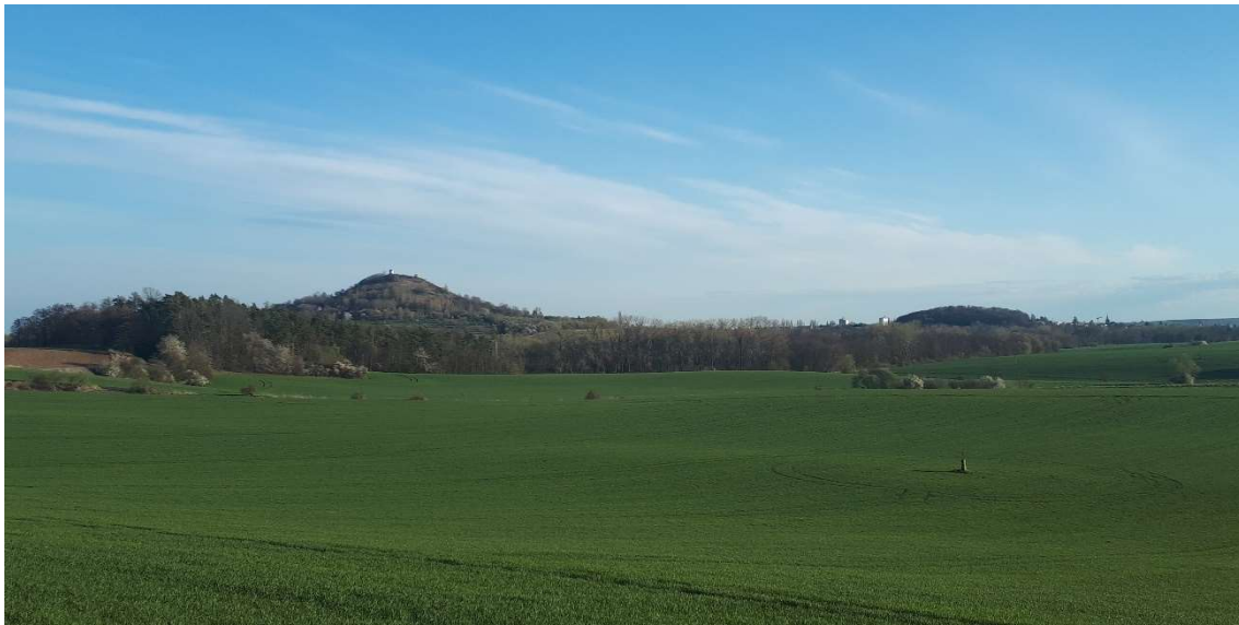
Fenomén: bývalá sopka Čeřovka (vpravo) v kontrastu se Zebínem (vlevo)

Téma: Čeřovka jako příklad sopky, která zatuhla pod zemským povrchem