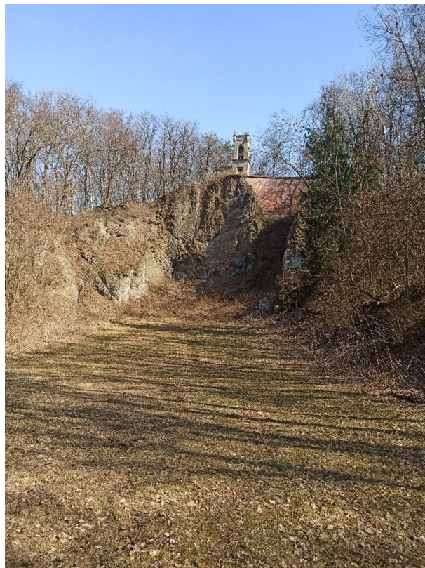
Fenomény: rozhledna Milohlídka a lom v kopci Čeřovka

Sdělení: Rozhledna Milohlídka vznikla původně proto, aby zachránila lidi, a nakonec zachránila i kopec Čeřovku.