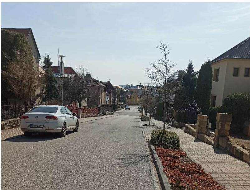
Fenomén: vilová čtvrť Čeřovka – pohled do ulice Dukelská

Sdělení: Prvorepubliková čtvrť Čeřovka je příkladem urbanistické kompozice, která pracuje s přirozeným reliéfem krajiny.